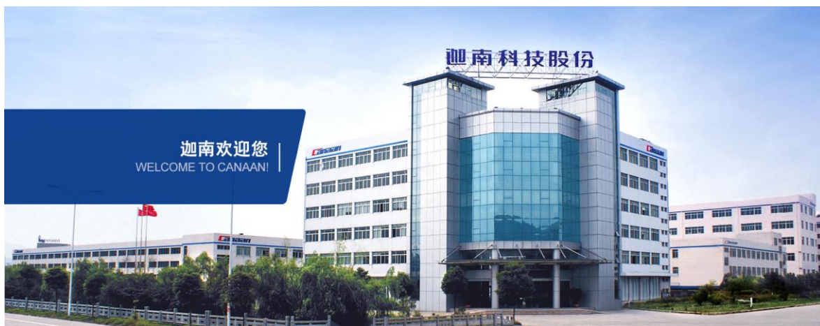
图 5-1 环保绿色的工厂